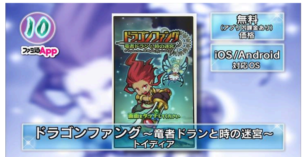
於各大遊戲媒體以及電視節目之露出新聞(部分)