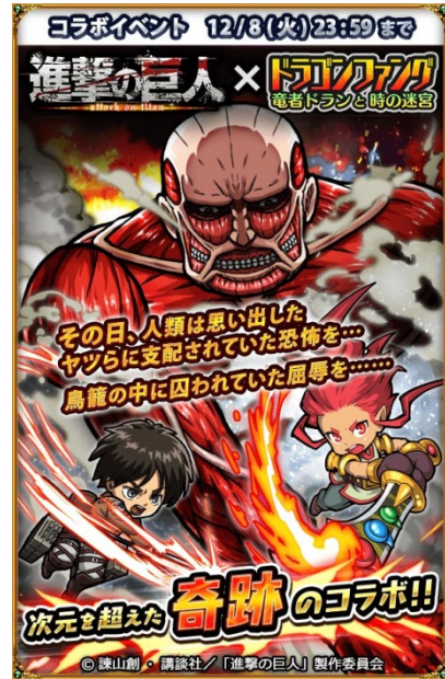
TOYDEA 超人氣作品[ドラゴンファンク], 並與與高人氣動漫「進擊的巨人」合作